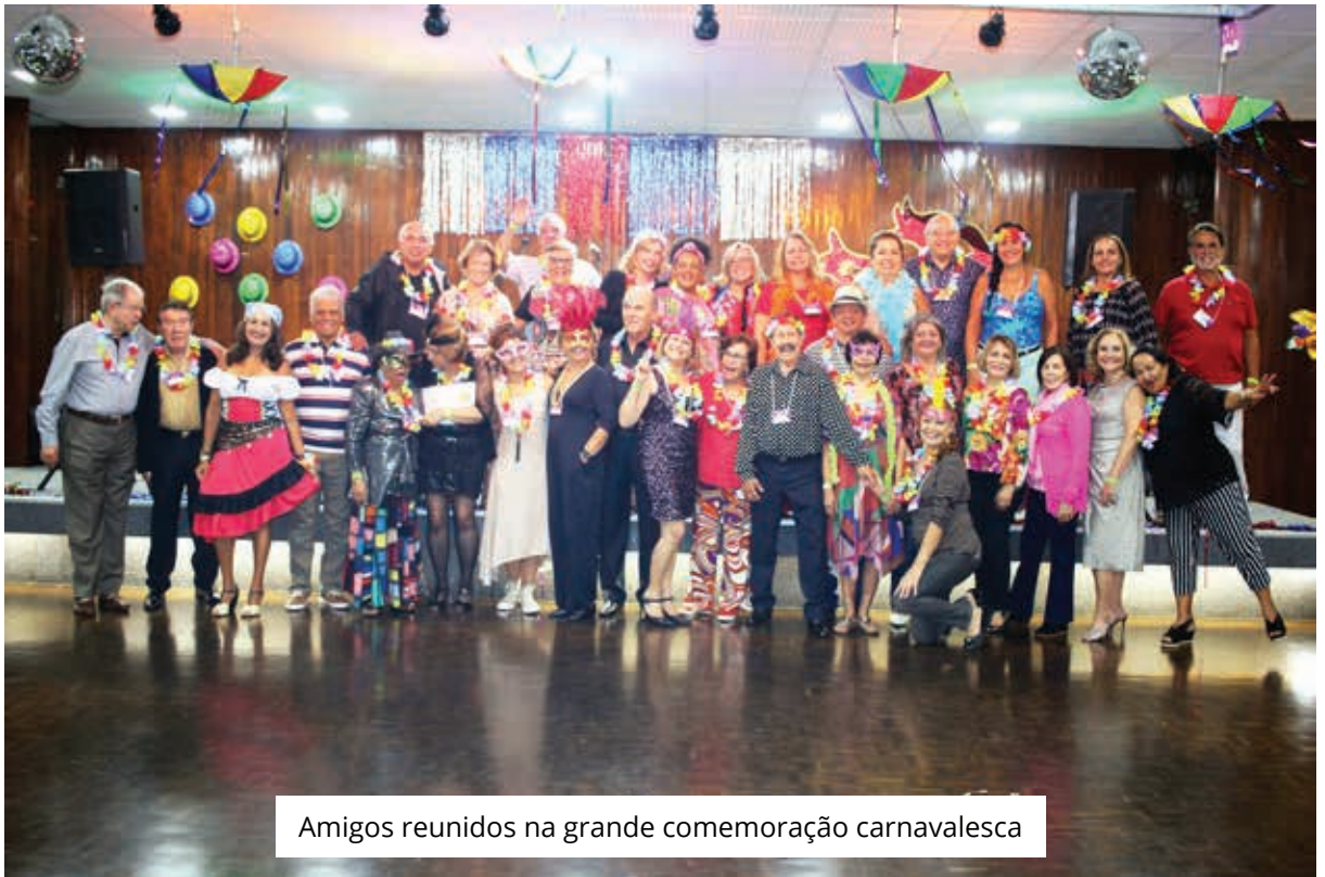
Amigos reunidos na grande comemoração carnavalesca

Unidos do Jardim Botânico (UJB) veio para o Prosa de Carnaval e não deixou ninguém parado.