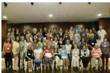
Prosa de Páscoa