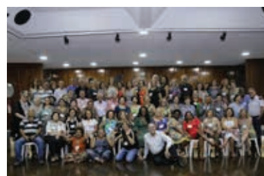
Prosa dos Pais