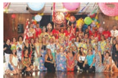
Prosa de Carnaval