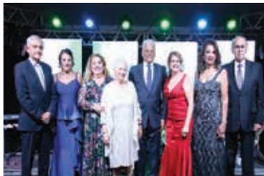
Baile de 28 anos da ASA-CD