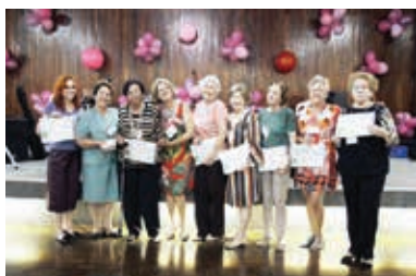
Prosa das Mulheres