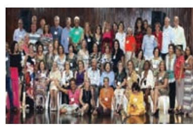
Prosa do Amor