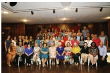
Prosa de Natal