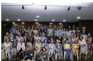
Prosa da Primavera