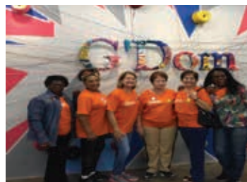
ASA no Quilombo